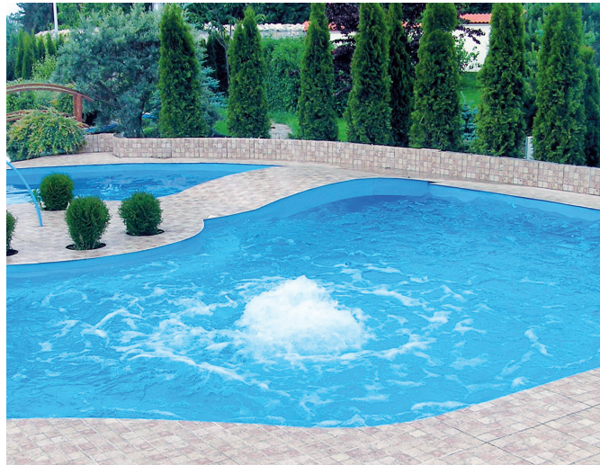
Przykład zastosowania dmuchawy do tworzenia „gejzera powietrznego”