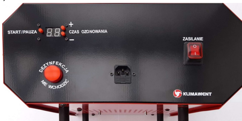
Rysunek 1 Panel sterujący

Panel sterowania jest wyposażony w gniazdo męskie wtykowe do podłączenia przewodu zasilającego z uziemieniem, włącznik podświetlany O / I , wyświetlacz z przyciskami kontroli czasu pracy oraz lampkę ostrzegawczą „ DEZYNFEKCJA – NIE WCHODZIĆ ”. Przed uruchomieniem sprawdź, czy przewód zasilający nie jest uszkodzony.