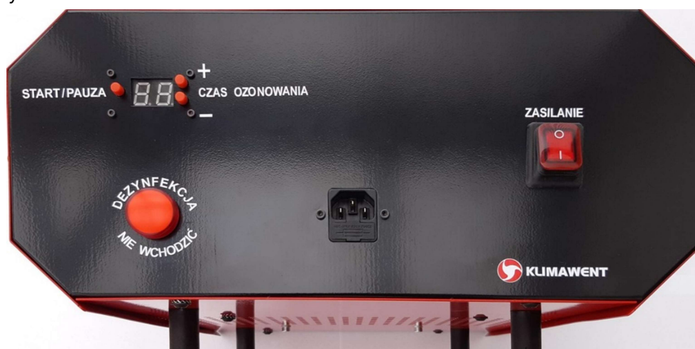
Rysunek 1 Panel sterujący

Panel sterowania jest wyposażony w gniazdo męskie wtykowe do podłączenia przewodu zasilającego z uziemieniem, włącznik podświetlany O / I , wyświetlacz z przyciskami kontroli czasu pracy oraz lampkę ostrzegawczą „ DEZYNFEKCJA – NIE WCHODZIĆ ”. Przed uruchomieniem sprawdź, czy przewód zasilający nie jest uszkodzony.