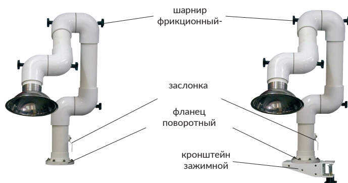
Устройство закрепляемое непосредственно

риалов (ПХВ, полиамид, нержавеющая сталь). Местные вытяжные устройства применяются в следующих отраслях промышленности: химическая, фармацевтическая, электронная, ювелирная. Устройство может работать с одним вытяжным вентилятором с соответствующей производительностью подключенном к сети к которой подключается несколько десятков местных вытяжных устройств.