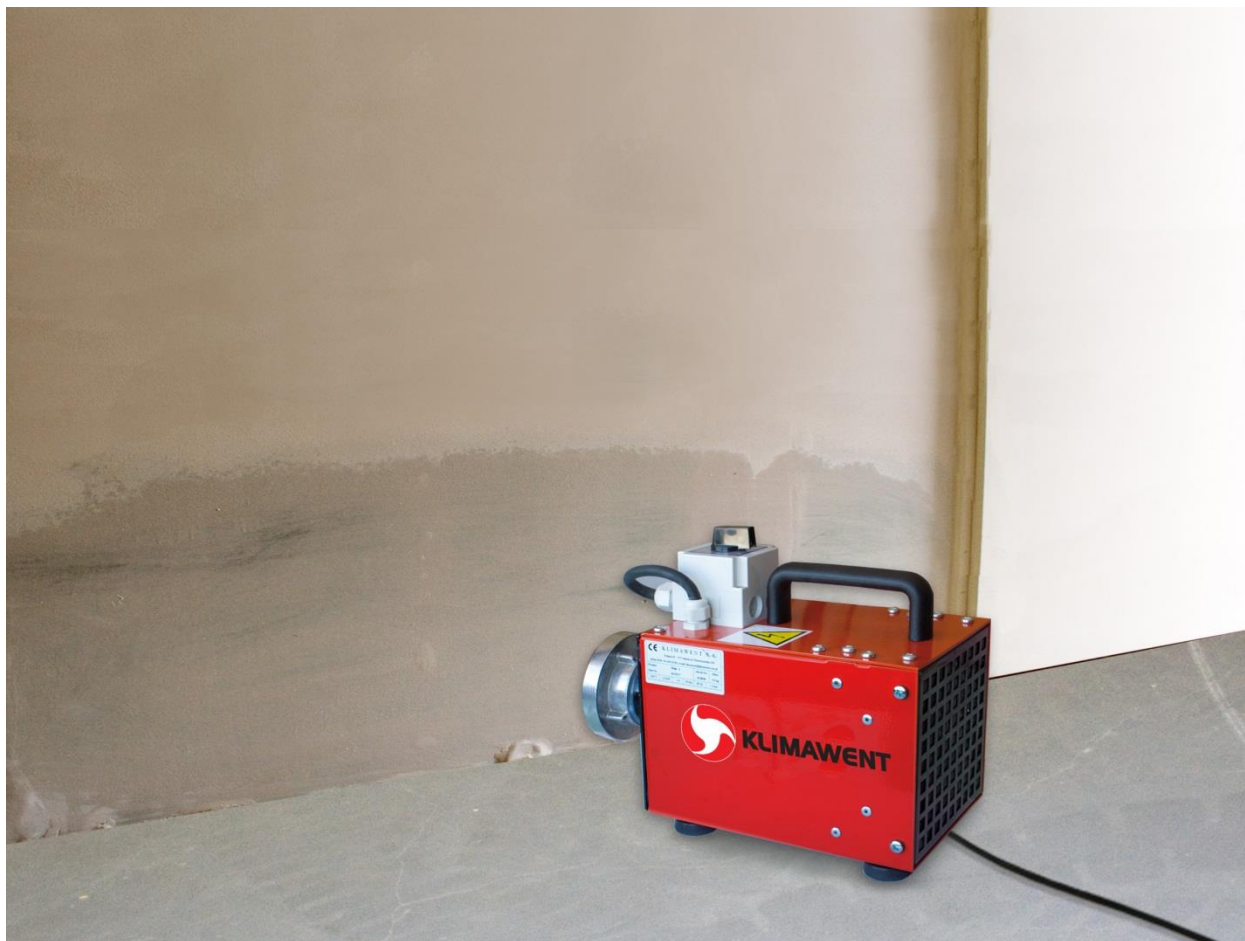
Fot.3 Osuszanie ścian

Do osuszania wylot dmuchawy należy ustawić w odległości kilkudziesięciu centymetrów od zawilgoconej ściany, a po osuszeniu fragmentu ściany należy przestawić dmuchawę w inne miejsce (Fot.3). Wskazane jest, by osuszane pomieszczenie posiadało swobodny dopływ świeżego powietrza, co można uzyskać wywołując naturalny przeciąg w pomieszczeniu. Efekt suszenia jest dobry pomimo niedużej wydajności, ponieważ podgrzane powietrze wydostaje się pod dużym ciśnieniem penetrując przegrodę w głąb, ułatwiając dyfuzję pary wodnej.