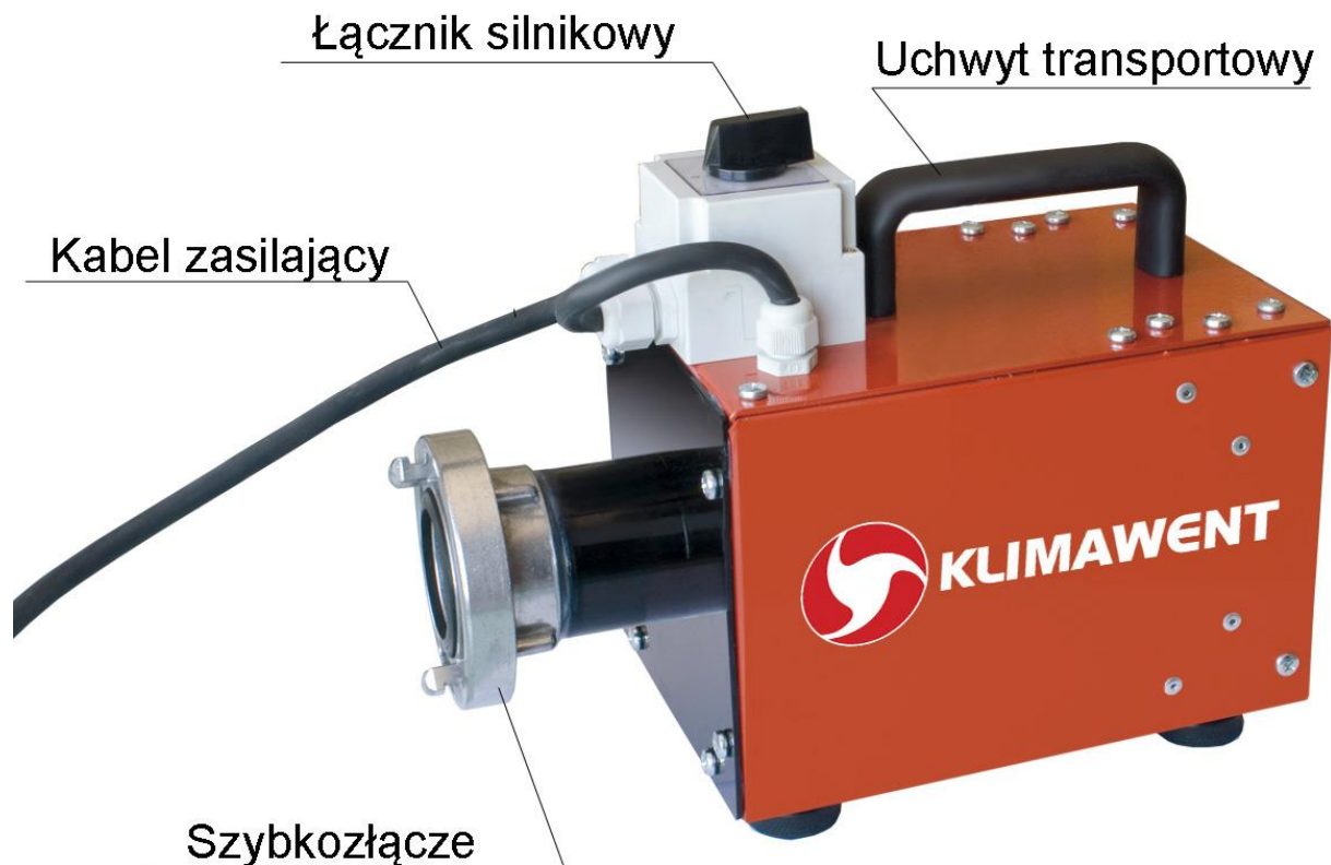
Fot. 1 DOG-1, budowa