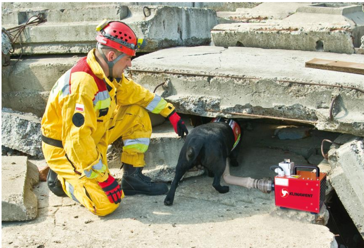
Fot.4 Zastosowanie dmuchawy w akcji ratunkowej

Dmuchawa wyposażona jest w kabel zasilający o długości 5m zakończony wtyczką.