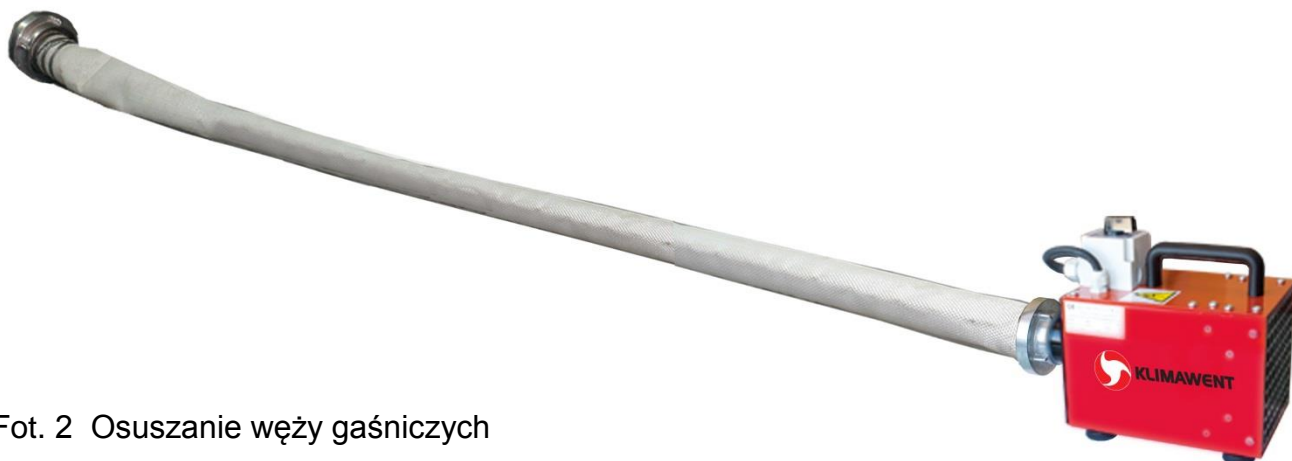
Fot. 2 Osuszanie węży gaśniczych

Obudowa posiada uchwyt służący do przenoszenia urządzenia. Na górnej ścianie obudowy znajduje się łącznik silnikowy służący do uruchamiania turbiny. Turbina włącza powietrze do podłączonego węża elastycznego. Urządzenie posiada standardowe szybkozłącze ułatwiające podłączenie węży gaśniczych. Tłoczone powietrze napręża wężę, a podwyższona temperatura tłoczonego powietrza skutecznie je osusza (Fot.2). Powietrze opuszczające dmuchawę ulega podgrzaniu o ok. 30 °C.