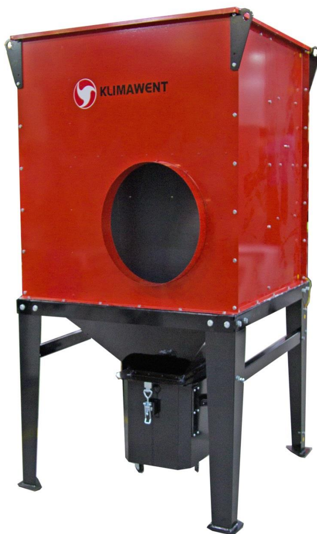
Separator typu SEP-UFO-A-10000