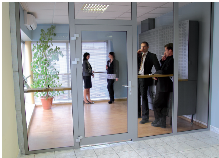
Пример оранжировки SMOKE ABSORBERA в специально выделенном пространстве внутри здания

оборудование для поглощения никотинового дыма